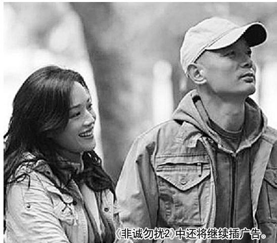
(非诚勿扰2)中还将继续插广告。