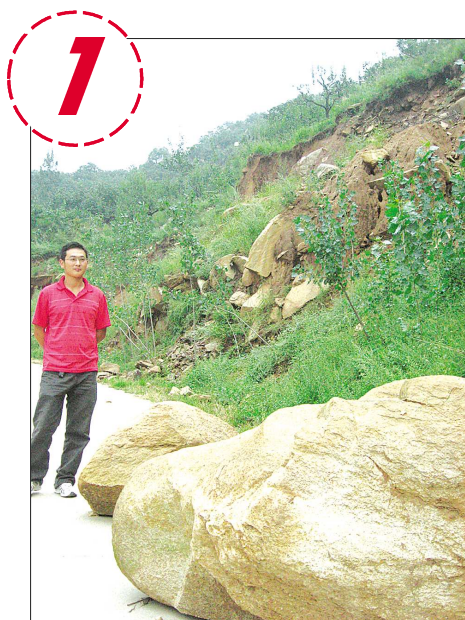
滚落在路边的巨石。

舟曲、云南贡山先后发生泥石流导致人员伤亡,济南“怪坡”路段近日也发生了山体滑坡……一系列事件的发生,使地质灾害防治工作格外引人关注。25日,记者探访了济南市的历下区燕翅山不稳定斜坡隐患、天桥区药山山体崩塌隐患和长清区拔山村山体崩塌隐患。