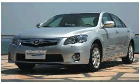
耗仅为6.2L 凯美瑞混合动力,百公里城市油