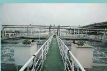
国家一级排放标准的污水处理站