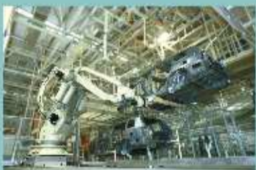
广汽丰田先进的生产线