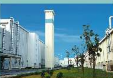
工厂内的烟囱都穿上了崭新的“外衣”