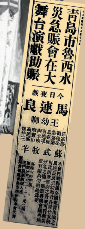
▶青岛鲁西水灾急赈会报纸广告