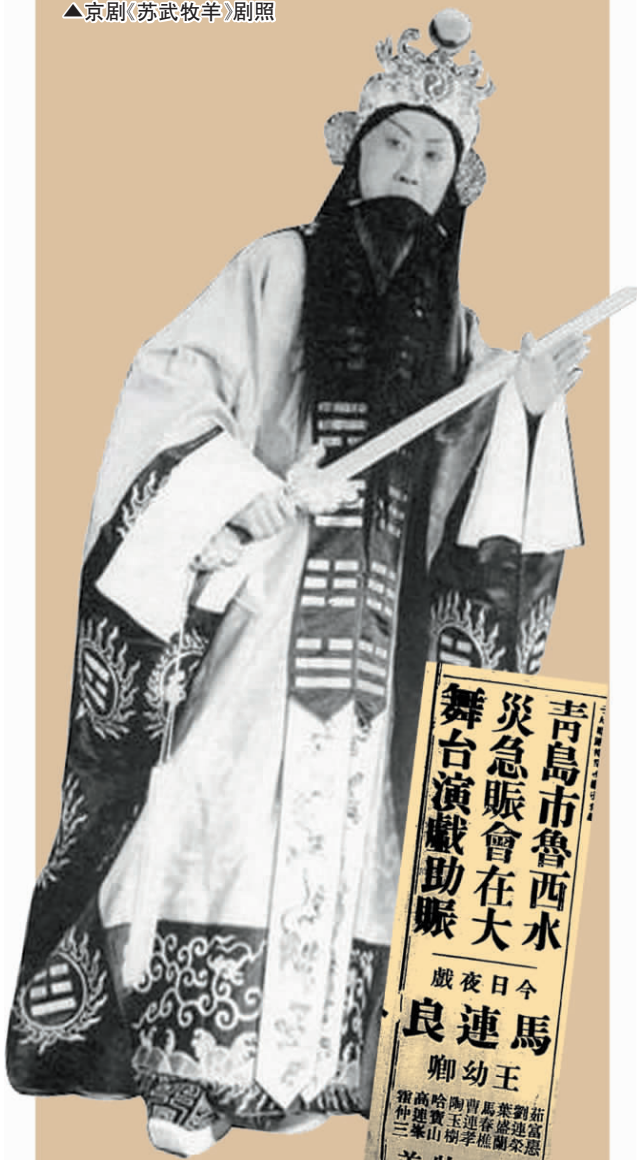
▲《借东风》中马连良饰演的诸葛亮