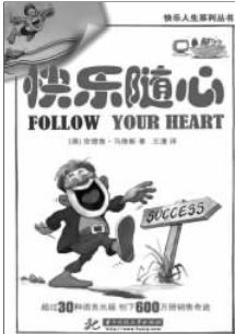
“快乐人生”系列 [澳]安德鲁·马修斯 著 华中科技大学出版社