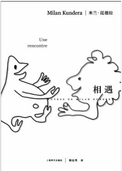
《相遇》 [捷]米兰·昆德拉 著 上海译文出版社

“当一个艺术家谈起另一个艺术家,他谈的其实始终是自己(间接地或拐弯抹角地),他的判准也在此表现出来。”米兰·昆德拉论析画家培根的这段文字,其实很适合移来形容他的新书《相遇》——他不断地在其中“谈