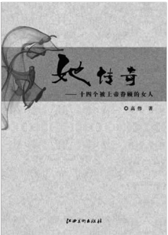
《她传奇》 高伟 著 江西美术出版社

言为心声。镜子造出来是照自己用的。高伟用她书写的是《她传奇》,为自己制造了十四面镜子,原来是用来照别人的,虽然她试图不断