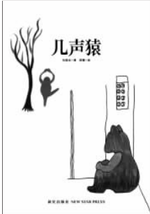
《几声猿》 仇敏业 著 陈蕾 绘 新星出版社