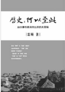
《历史:何以至此》 雷颐 著 山西人民出版社

己,一心要求实现一个现实世界无法实现的理想;另一个是被生产商、被大众、被媒体按照自己的兴趣所塑造的时尚生活标签。现在我知道了,格瓦拉对时尚有着致命的喜爱,对作秀和镜头有着强烈的敏感度,而浪漫和诗意的生活,更是他一生永远的追求。他的绝不可能重来一次的古巴革命(那么富有戏剧性)、他的游击战、他的刚果革命和拉美革命,本身就是一出浪漫而虚幻的戏剧。而当他见到毛泽东时,竟然像歌迷见到心仪已久的偶像一样,紧张得说不出话来,而毛泽东说的第一句话是,“切,你好年轻哟”。这样的格瓦拉,是真实的格瓦拉,只有这样的他,才能这样描述伟大的古巴革命:“这次革命是第一部纯真的即兴创作,是宇宙中组织得最完美的一场混战。”