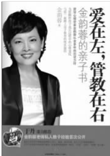
《爱在左,管教在右》 金韵蓉 著 中信出版社