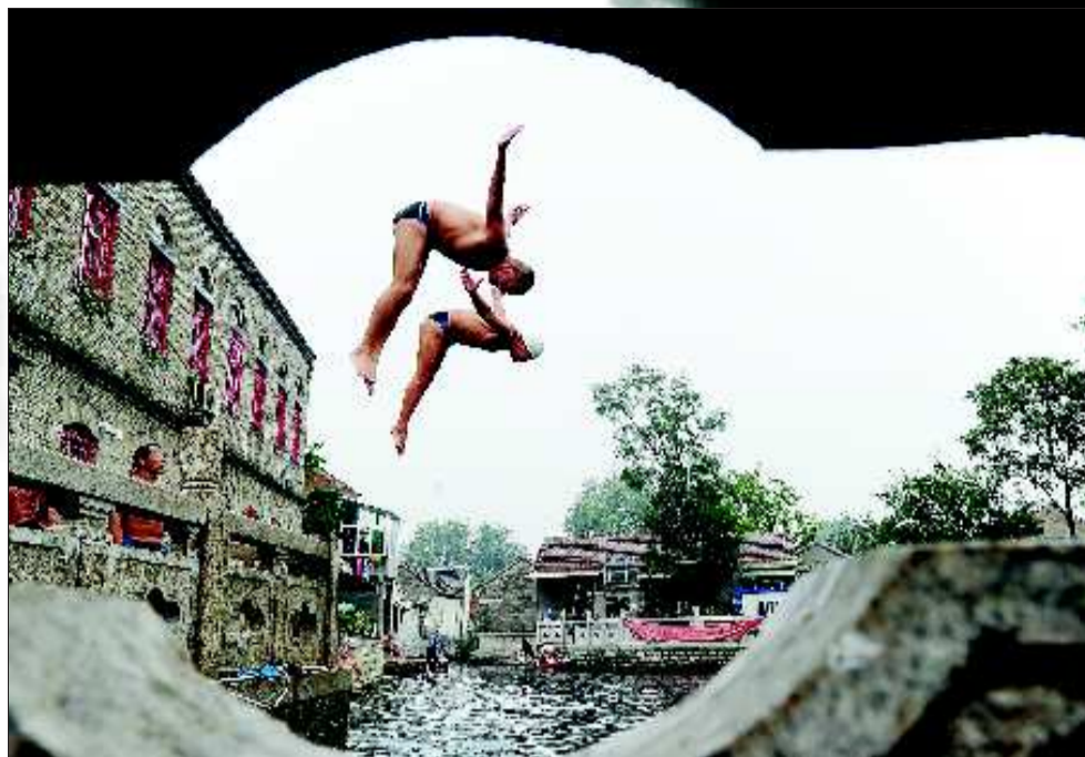
在王府池子，市民们用跳水的方式庆祝泉水复涌七周年。