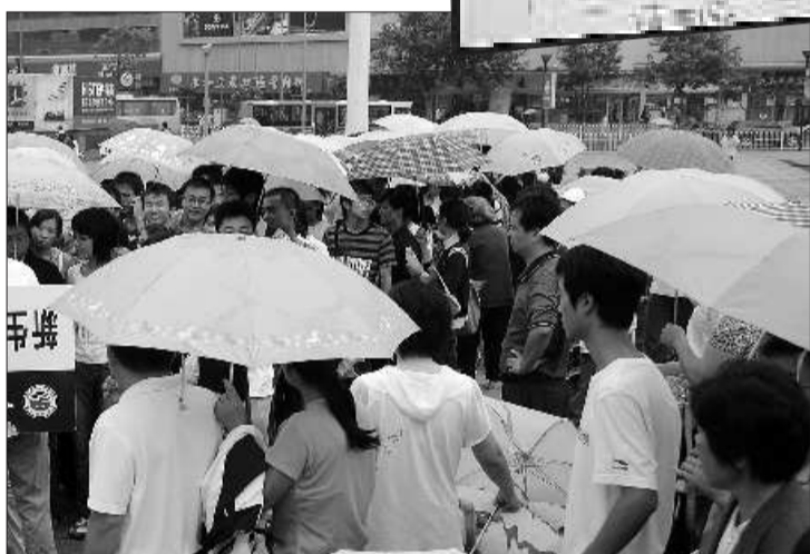
9月3日-4日,当市民对降雨预报产生怀疑时,青岛普降大雨。记者 张晓鹏 摄

不过,这次的预报却非常准确,根据青岛市水文局统计,2日晚至4日15时,青岛普降大到暴雨,局部降大暴雨。