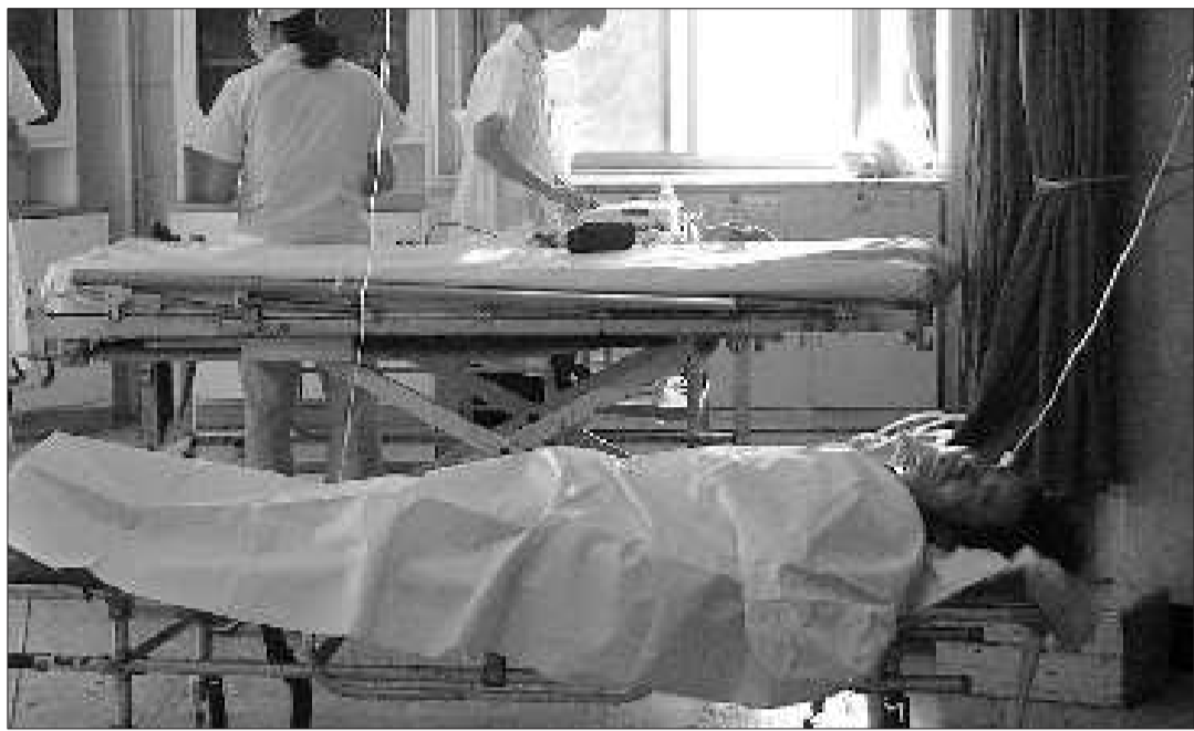
急救室里张师傅非常虚弱。

本报青岛9月15日讯(记者 赵郁) 15日上午10时许,在青岛市长沙路一处建筑工地上,一名工人在维修搅拌机时,被一辆自行溜车的铲车铲断双腿,目前正在医院接受治疗,由于伤情严重,左腿有截肢的可能。