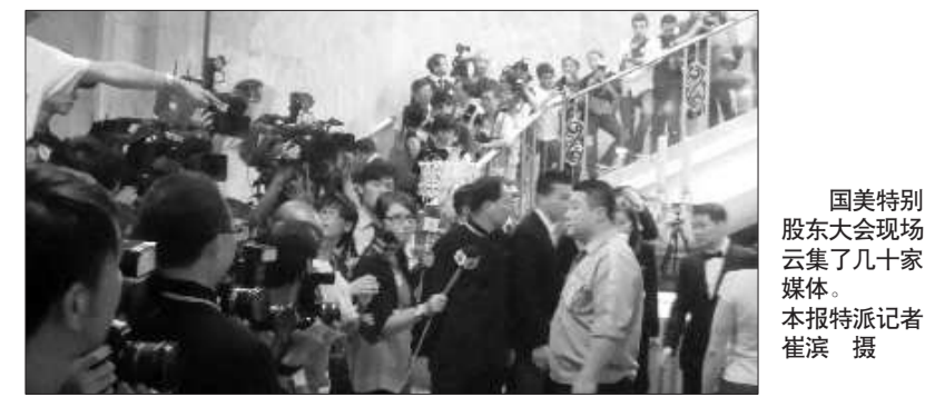
国美特别股东大会现场云集了几十家媒体。

胎记治疗专家齐聚齐鲁,为万名胎记学生提供救治行动。胎记治疗专家齐聚齐鲁,为万名胎记学生提供救治行动。胎记治疗专家齐聚齐鲁,为万名胎记学生提供救治行动。胎记治疗专家齐聚齐鲁,为万名胎记学生提供救治行动。