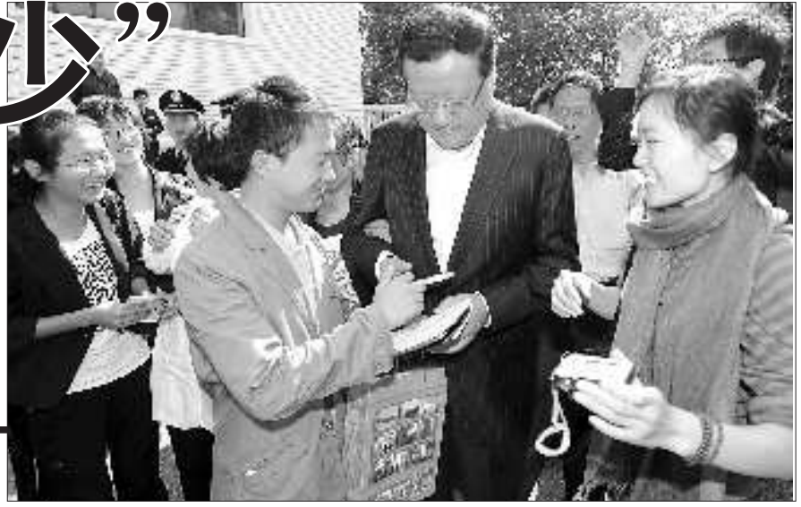
刘长乐“粉丝”众多。

此话开启了齐鲁大讲坛的互动环节,听众的问题五花八门,包罗万象,不乏尖锐之问,但刘长乐——作答,其睿智,幽默,引起现场掌声不断。