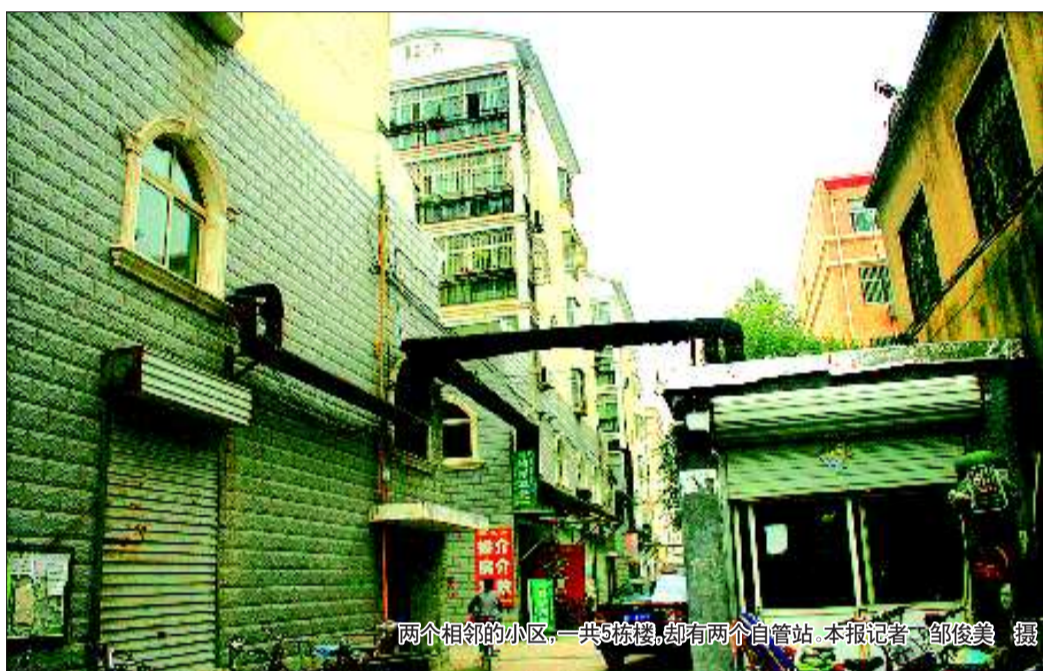
两个相邻的小区,一共5栋楼,却有两个自管站。本报记者 邵俊美 摄

“我们去年赔了近一万块钱,还是有居民家里温度不达标,平时我们物业公司和业主关系很融洽,可一到供暖季节关系就闹得很僵。”将军苑小区物业刘经理希望,他们小区的自管站能归供热企业直接管理。