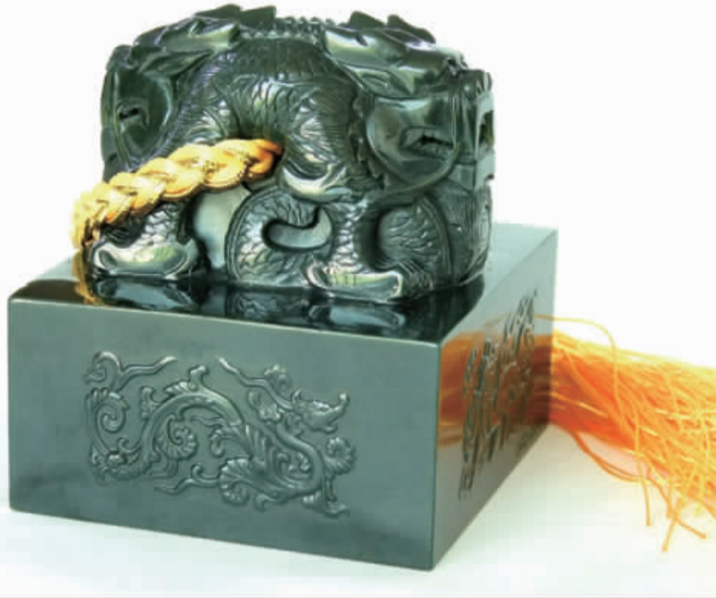
宝玺通高 8.6 厘米，玺钮高 5.6 厘米，代表 56 个民族大团圆；龙钮是威猛霸气的盘龙，龙腹穿孔附系黄色绶带，底部正方形印面边长为 8 厘米，象征中国的四面八方。四面刻有龙、凤、龟、麒麟四大吉祥物，象征龙凤呈祥、健康长寿。印面凸雕篆刻世博会徽，图案形似字“世”，与“2010”巧妙组合，相得益彰。宝玺大气天成，巧夺天工，光耀王者风范！

物以稀为贵，为彰显“世博宝玺”无与伦比的至尊地位和极大的升值空间，全球只发行 2010 尊，仅供少数幸运藏家荣耀典藏。每尊都雕刻唯一限量编号，以后永不复制。每套均由上海世博局授权方可制造，并配有人民币防伪高科技制造的世博特许标签和国家出具的玉石《鉴定证书》，鉴定结论尊尊均为和田玉。