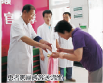
患者家属感激送锦旗