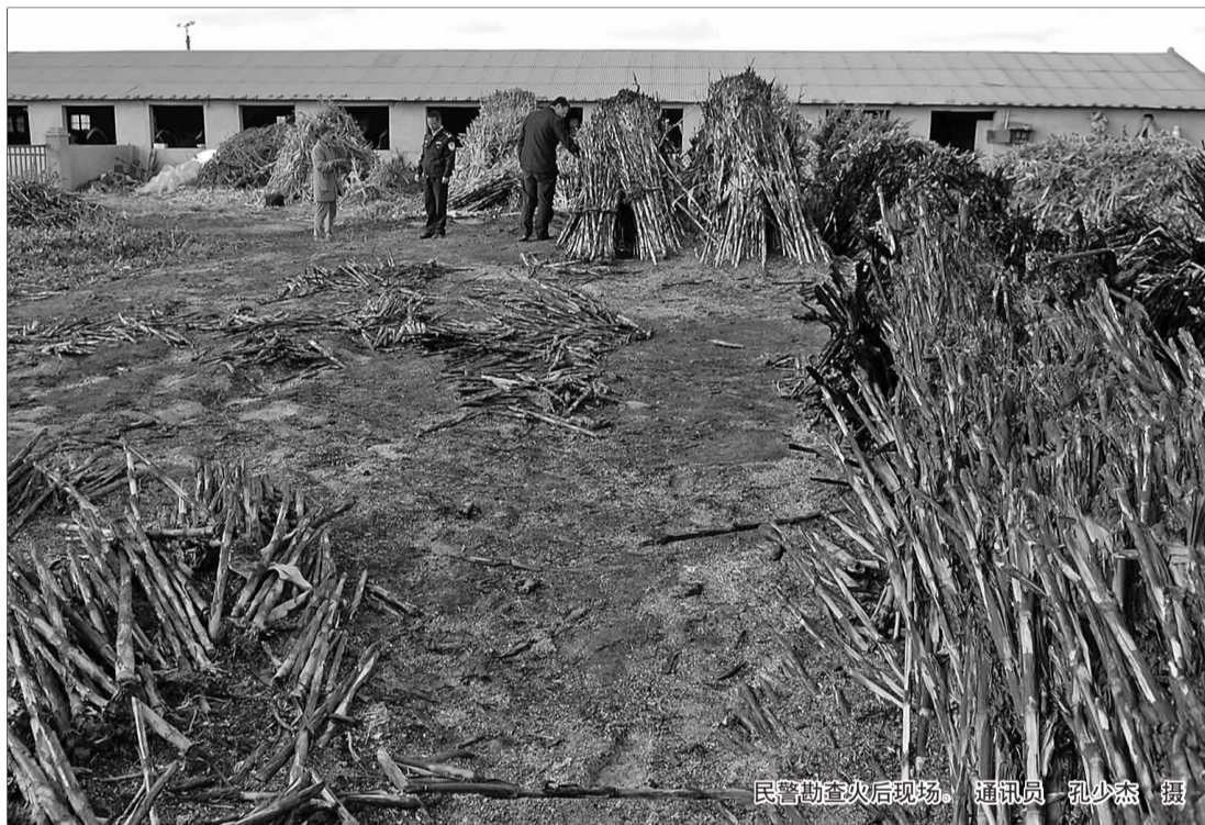
民警勘查火后现场。