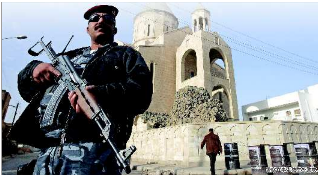
警察在事发教堂外警戒。