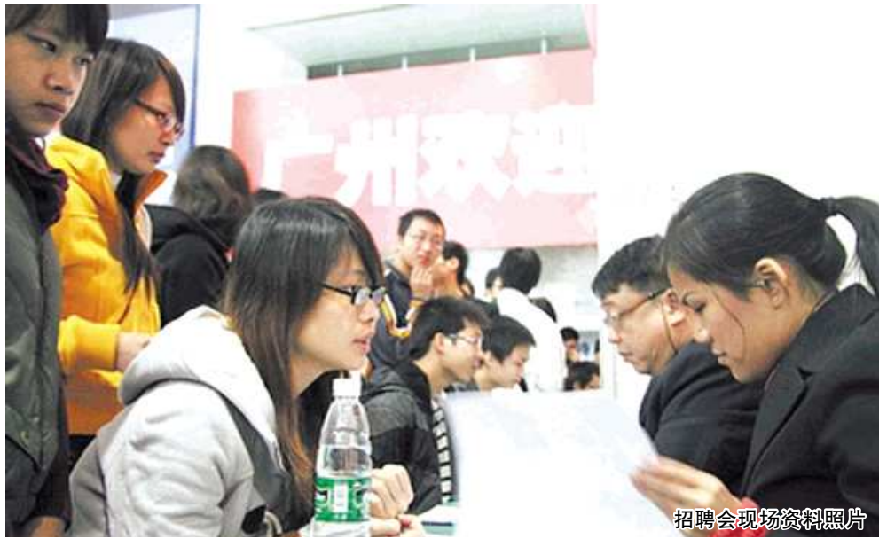
招聘会现场资料照片

自本报名校名企人才交流峰会上周启动以来,企业和高校报名踊跃。不少报名单位表示,这种人才交流新方式大大提高了校企合作的效率,学校能够更有针对性地推荐毕业生,而企业也极大地减少了招聘成本和时间。据了解,2011年我国大学生毕业人数将达到峰值758万,本报特发起本次2010山东高校名企人才交流峰会,形式和深度、搭建平台的顺畅程度都将令供求双方有突破性的进展。目前峰会还在热招中,感兴趣的企业和高校可以致电本报报名。 时间:2010年11月20日