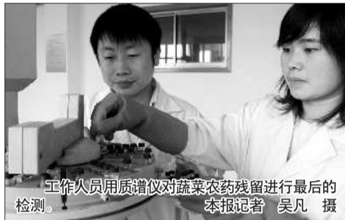
工作人员用质谱仪对蔬菜农药残留进行最后的检测。

自从安丘蔬菜被亚组委确认为直供蔬菜之后,安丘外贸食品公司的一线工人们显得格外忙碌。1日下午,记者跟随工作人员来到包装蔬菜的恒温库中,接近零度的室温让记者直打哆嗦,说话都哈出热气,负责对蔬菜进行包装工