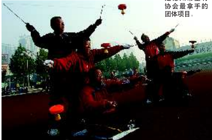
▼叠罗汉是德州市空竹协会最拿手的团体项目。