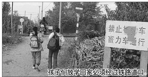
孩子们放学回家必须经过铁路道口。