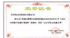
2010中国数字电视年度成功大奖