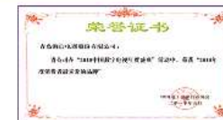
2010消费者最喜爱的彩电品牌大奖