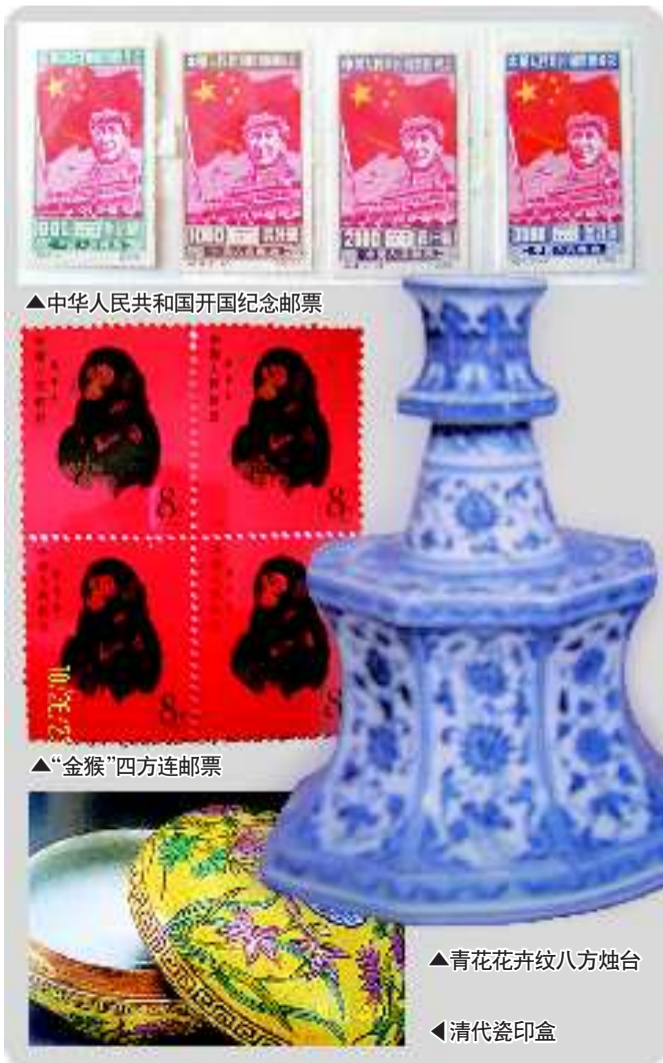
▲青花花卉纹八方烛台