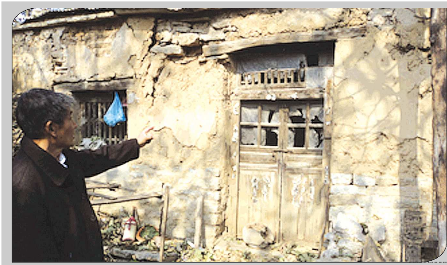
抗战时期,罗荣桓元帅的办公遗址。