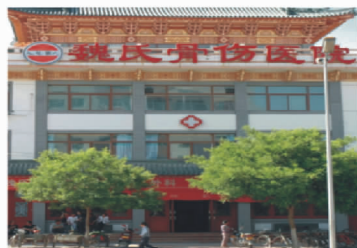
↑位于甘肃天水的魏氏骨伤医院