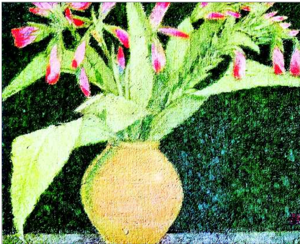
▲庞薰琫作品《美人蕉》