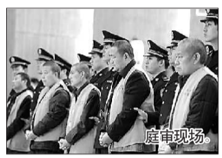
据新华社郑州11月16日电

16日,河南省平顶山市中级人民法院宣判,明知井下瓦斯超标仍组织大量工人下井作业,致使煤矿发生瓦斯爆炸造成76人死亡、15人受伤的平顶山市新华区四矿5名矿长,4名以危险方法危害公共安全罪,伪造事业单位印章罪被判刑,1名以强令违章冒险作业罪被判刑。据悉,这是我国首次以危害公共安全罪判处事故矿矿长。