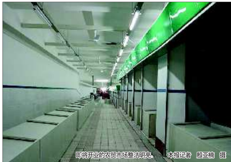
即将开业的农贸市场整洁明亮。

本报11月16日讯(记者 殷亚楠 通讯员 管璐 彭汝安) 16日,整修一新的山师东路农贸市场亮相了。前期,历下区文东街道办事处投资60余万元对农贸市场进行了全面改造提升,市场的供电、排污等管线得到改善,并开通了斜坡便民通道。目前,市场正在组织招商、商户签约等,进行开业前的最后准备。