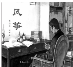
《风筝》 鲁迅 文 大钧 图 连环画出版社

放风筝是一个让心升起来的游戏。手里的那一根很细的线,可以被那个纸糊的东西带到那么高的天上;那根很细的线,又能把那个“升起”、那个“飘晃”紧紧地扯住,不让它消失在无边,也不让它栽落到地上。那是一个被很细的线牵着的游戏,那也是一个能把很细的线带到天上去的飘荡。这个