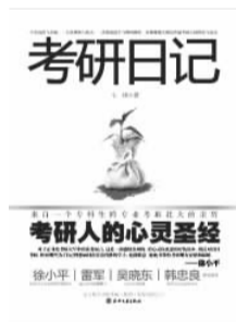
《考研日记》 小楼 著 春风文艺出版社

一个刚毕业的大学生,在不断的彷徨与挣扎中,最终还是选择了考研。跨专业,考北大,一切从零开始。从此,宿舍,食堂,自习室,图书馆,线条化的生活让小楼与世隔绝,人生失去颜色却又充满另一种芬芳。就这样,经过18个月的坚持与努力,终于考取了北京大学。这本《考研日记》,真实记录了作者小楼奋斗与成功的心路历程。从小楼身上,你不仅能看到普通人通过努力获得成功的传奇经历,还能学到关于考研的各种技巧与经验。