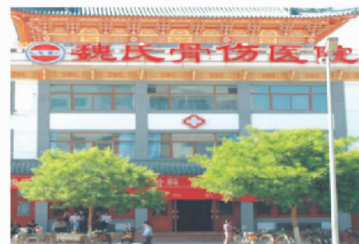
↑位于甘肃天水的魏氏骨伤医院