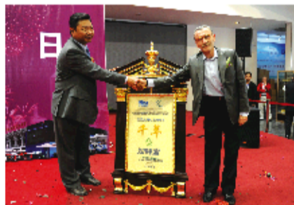
联合国国际信息发展组织总干事丹尼尔·巴瑞奥为北京知蜂堂颁授“联合国千年金奖”

千年金奖始于2000年 发起于联合国 知蜂堂 一个蜂胶生产企业 凭什么进入联合国之“眼” 2010年10月16日 知蜂堂荣获联合国“千年金奖”殊荣 这又是何等荣誉