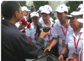
知蜂堂质检部黄部长向参观代表讲解“真胶”和“树脂”的区别

一、知蜂堂建立自己的蜂胶“前处理”厂,引进先进分析仪器把原料质量关。目前,大多数蜂胶厂家没有原料的“前处理”厂,而是从其它的蜂产品企业购