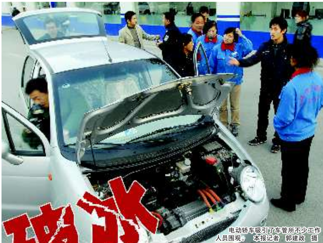
电动轿车吸引了车管所不少工作人员围观。