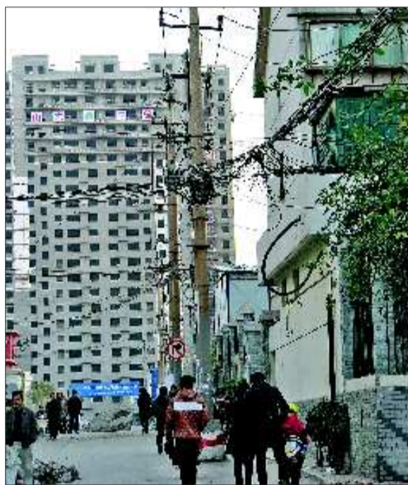
改造后,街道上空的高压电缆等将统统入地,街道会变得整洁漂亮。

济南市历下区市政部门有关负责人告诉记者,电缆入地改造是实现该片区交通微循环的重要部分。由于紧挨泺源大街,改造后的几条街巷要承担为附近车辆分流的任务。