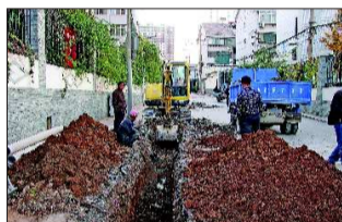
施工队伍开始挖掘管道沟。

据了解,司里街片区位于泺源大街以北、黑虎泉以南、南门大街以东、太平街以西,紧邻黑虎泉,居民小区建于上世纪90年代初。小区及小区周边道路上到处竖立着各种各样的线杆,有的紧挨小区院墙,有的线杆还立在马路中间。司里街片区共有110根线杆,有10根上面已经没有任何电线,有4根是非常老旧的木质线杆。由于街巷道路宽度有限,电线杆给过往车辆通行造成了一定的潜在