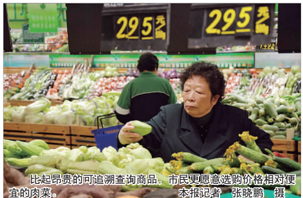
比起昂贵的可追溯查询商品,市民更愿意选购价格相对便宜的肉菜。本报记者 张晓鹏 摄

发个卡片,这个卡片也相当于追溯码,因此如果在蔬菜批发市场购买的菜出现问题,也可以进行追溯。“目前最难的就是农贸市场,如果商户不从批发市场进货,就很难追责,商务局也正在进行系统调研。”青岛市商务局相关人士说。建立追溯系统难点,还在于企业的积极性。国外都是立法强制企业加入溯源系统,如果企业没有溯源条码,是无法进行销售的,这就强制企业养成了习惯,建立溯源系统后才进行销售。而青岛有一些企业自己也建了溯源,但是往往因为成本较高,而市民查询的少,最后不了了之。