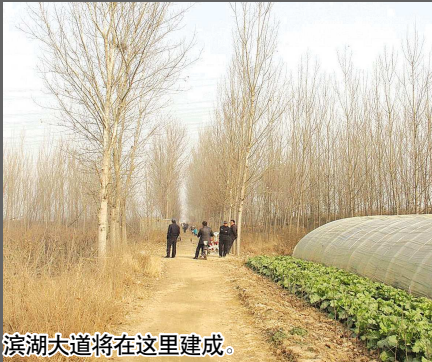
滨湖大道将在这里建成。