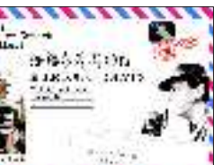
◆作者:儒爵爷 ◆出版社:吴昊轩出版社

类的东西。唯一令人生疑的地方,便是桌上电话机的话筒没有放在机座上,而是垂直地悬挂在空中。 很快我们就移步进了楼梯间准备上二楼。在进入楼梯间那一瞬,我回头再看了一眼那幅遗像,竟然发现那端对着面对大门的脸,此刻却转了过来,对着我露出诡异的笑容,冷冷的眼睛里闪烁着迷离的光芒! 我惊叫一声,脚下一个趔趄险些摔倒,瑞恩把我扶着,老福转过头来问:“怎么了?” 我抬起手指过去,扭头再看,却发现那遗像好好的,和开始一样没有任何变化。我使劲地揉了揉眼睛,依然如故,便拍了拍身上的尘土说:“没事,没事,脚下打滑。” 老福还是侧头瞥了一眼我刚才所指的方向,停滞几秒后,便转了回来,抬步拾阶而上。 随着楼梯上去,是两间并列的房间,门都朝前开。左边的一间是卧室,看里面的整齐的摆设和收拾过的痕迹,应该是常住人的;右边则是被当成了一间储藏室,一些农用杂物都堆放在这里了。 跟着老福溜达了一圈之后,我们就下楼出来了。老福继续在客厅里面仔细查看着,似乎是在寻找什么东西。之后又若有所思地点了点头,就径直走出了屋子。 这时候院子外围观的群众被驱散了不少,但是