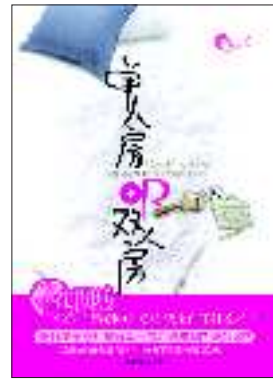
◆作者:马识途 ◆出版社:陕西师范大学出版社有限公司

道的衣服,做了最后一次反抗。她摊开他的脸,趁他不备对着他颈侧咬下去,用力到浑身发抖,几乎咬掉了一块皮,他倒抽气,不得不扭开头捂着伤处,停下所有的动作。 她抹抹嘴角,快速爬离他能触及的范围,到浴室把自己反锁起来,筋疲力尽地躲在浴缸里。 房间里恢复了安静,她打开凉水,用淋浴一遍遍冲洗他碰过的嘴唇和沾着呕吐秽物的衣服。自从得知他再婚那一刻开始,她对他的渴望变成了极度的厌恶,厌恶他,也厌恶自己。今晚他说希望在30岁有一个孩子。 他们拥有过孩子,但失去了,还有很多他们曾经有过的东西,也随着时间的流逝付诸东流,无法挽回。 她错过了他,真的错过了。