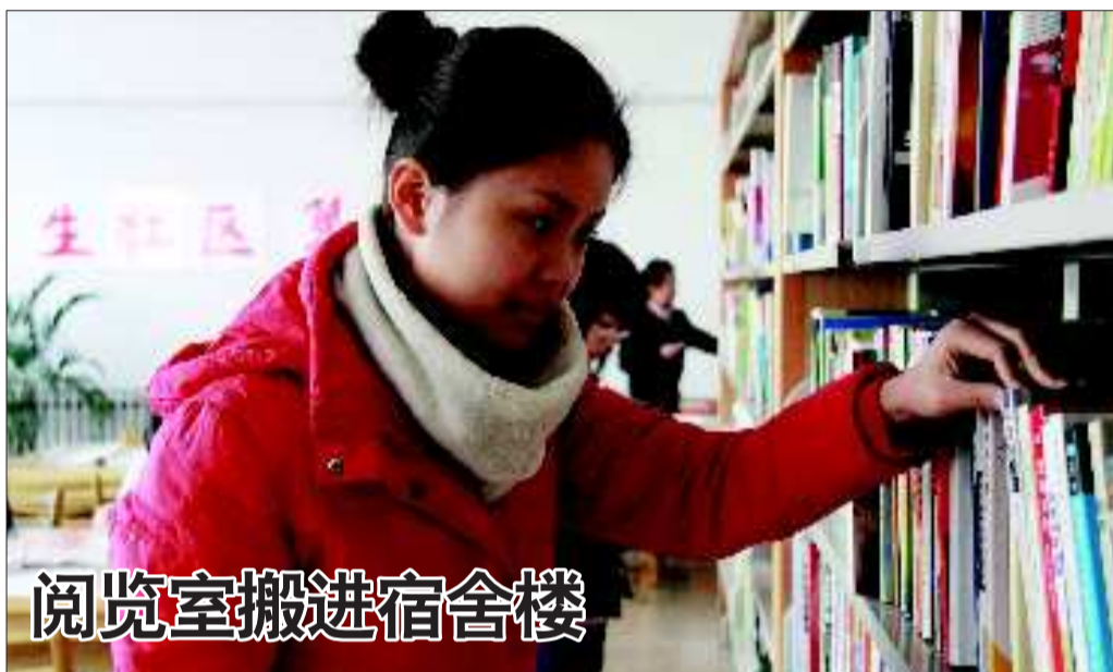
阅览室搬进宿舍楼

潍坊市民政局相关负责人表示,补贴发放已经在寒亭区率先展开,全市困难群众临时价格补贴将在第一时间发放完毕。