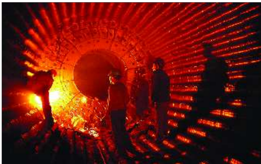
▲时光隧道 作品描述:山东华能威海电厂建设者在施工。