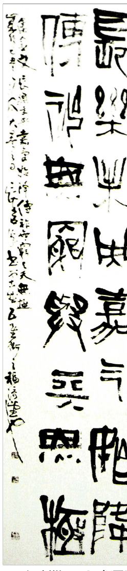
▲隶书 刘锐 ▼《五福图》花鸟画 季则夫 ▲行草 刘锐