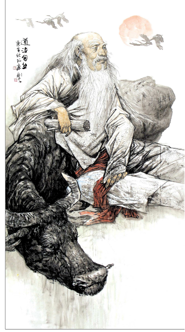
▲《道法自然》人物画 季则夫 ▼《晨风》花鸟画 季则夫 ▼《踏雪寻梅》花鸟画 季则夫 ▲《大风歌诗意图》花鸟画 季则夫

季则夫,号面壁居士,1945年生于河北南皮。9岁起拜徐连武为师,攻工笔花鸟,兼习楷、隶、行书法诸体,哈尔滨师范学院艺术系毕业。而立之年,入中央美术学院国画系高研班深造,师从周思聪、姚有多、陶一清、陈雄立等先生。1980年,作品《小院公大爷》获中国美协、煤矿文化基金会主办综合类美展二等奖;作品《孔子问礼图》入选“首届孔子艺术节”(中国美协主办)中国画展;2007年,作品《大风歌》入选第三届“全国中国画作品展”(中国美协主办),出版专著《季则夫画集》(荣宝斋出版社,2005.5)、《百犬图集》(荣宝斋出版社,2007.5)等。