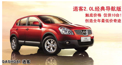
逍客2.0L经典导航版 触底价格 仅供10台! 创造全年最低价奇迹 东风日产大友专营店: 88880000 经十西路318号 东风日产省体专营店: 82039888 省体育中心东北处

季精品特卖”“维修保养”“金融按揭”和“二手置换”四重豪礼,此外还可参加百万抽奖活动,中奖百分百!1500元、3000元、6000元、最高10000元大奖等你拿!活动截至12月31日,仅剩7天!全年最低价订逍客。 尊贵热线: