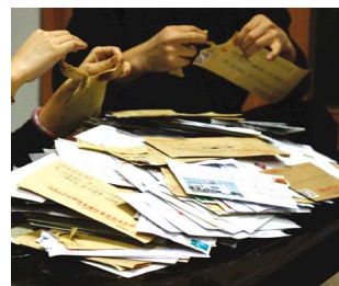
工作人员在认真整理读者回寄的问卷投票。