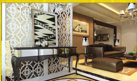
A6 户型入户花园改造及客厅效果图