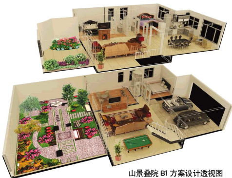
山景叠院 B1 方案设计透视图