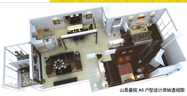
山景叠院 A6 户型设计原始透视图