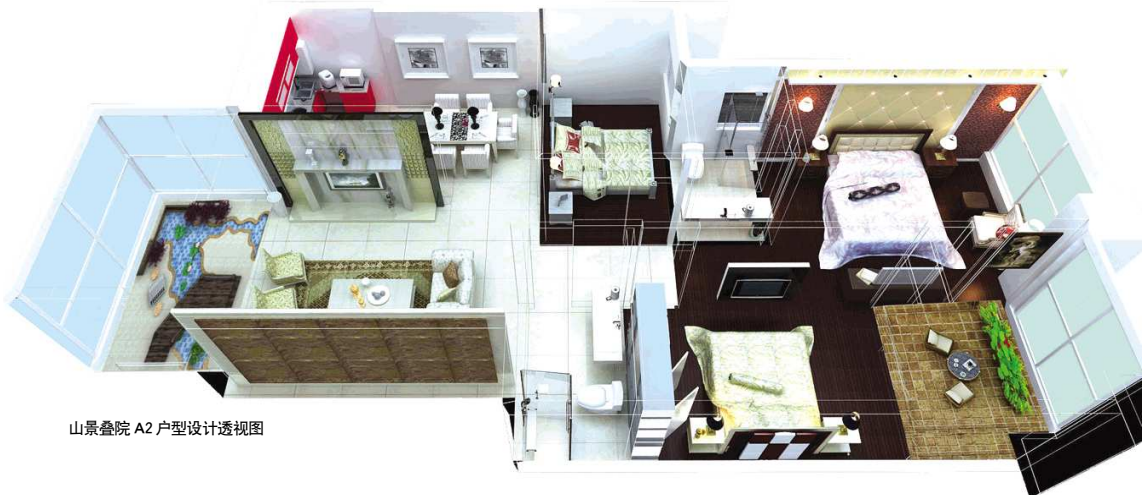
山景叠院 A2 户型设计透视图