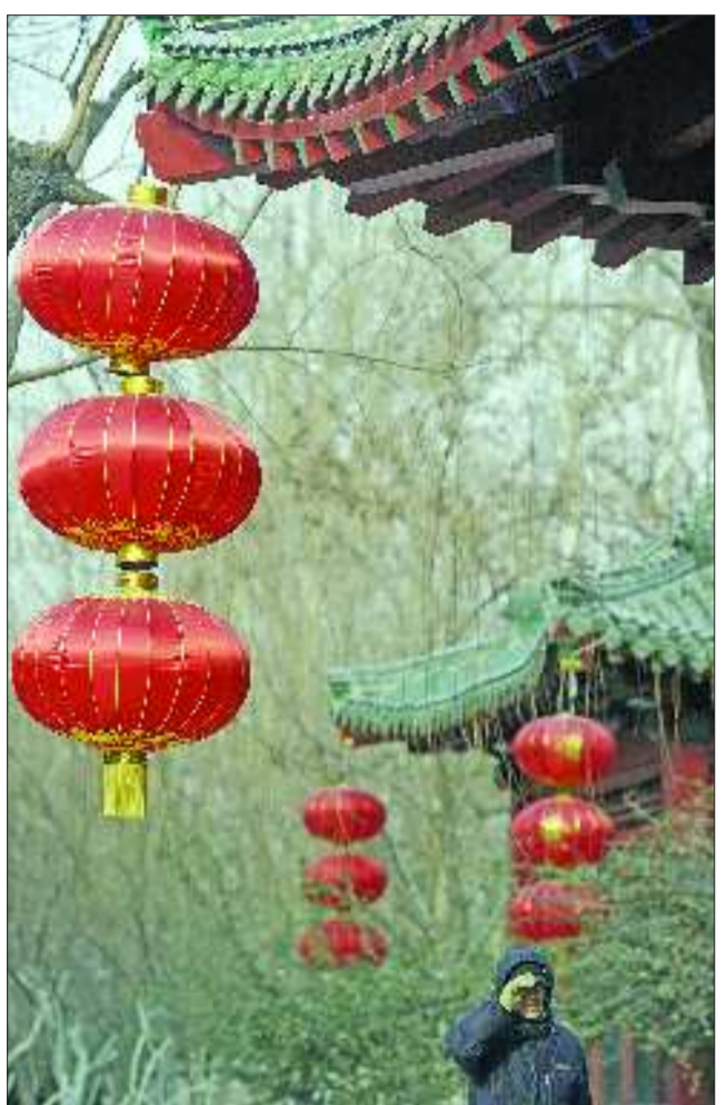
1月5日,济南护城河畔,一排排大红的灯笼高高挂起,让游玩的人们不禁感受到年越来越近了。