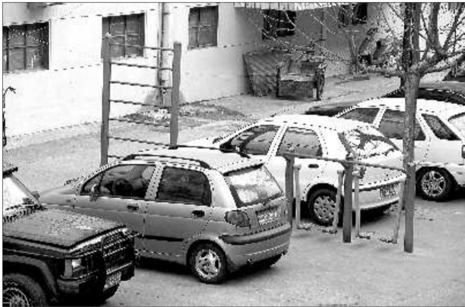
站前小区的私家车停在了健身器材旁边