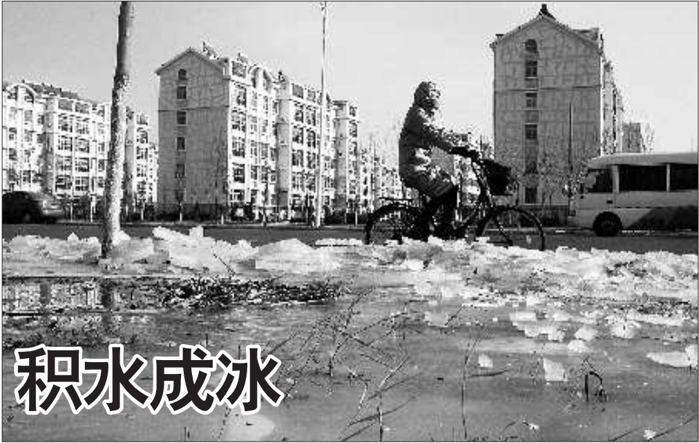
11 日上午 11 时许, 东一路锦华一区西侧, 一水管破裂导致积水成冰, 盖满了绿化带。在附近工作的一位环卫工人告诉记者:“这个水管已经漏了大约一个月了, 前两天淌得路上都是, 这几天差点了, 但水还是一直冒。”

自 2005 年开始, 东营市在全省率先实施农村老年人生活救助制度, 救助的范围是具有东营常住户口、年满 75 周岁、无固定养老金收入的农村老年人。救助的标准为: 年满 75 周岁、未满 90 周岁的每人每年 360 元; 90 周岁及其以上的每人每年 960 元, 百岁老人享受长寿补助金每人每年 1200 元。所需资金由市、县财政按 5:1 比例承担。