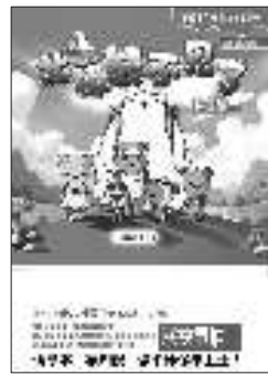
《北极熊不见了》 《小鱼儿不见了》 《森林不见了》 《蜜蜂不见了》 《珊瑚不见了》 赖有贤 著 山东文艺出版社