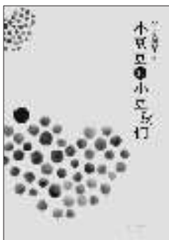
《小豆豆和小豆豆们》 [日]黑柳彻子 著 南海出版公司