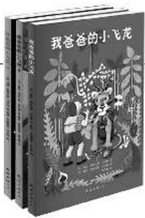
《我爸爸的小飞龙》 [美]鲁思·斯泰尔斯·甘尼特 著 南海出版社

三本小书讲述了“我爸爸”小时候的英勇故事。“我爸爸”在下雨的街上捡回来一只湿透了的老猫,把它藏在地下室,给它烤火取暖,给它喝牛奶,但母亲回来发现后大发雷霆,告诫“我爸爸”决不可以把街上的野猫带回家。“我爸爸”只好失望地把老猫送出去,他为人们的不礼貌向老猫道歉。老猫问起“我爸爸”的心愿,“我爸爸”说他想拥有一架飞机,可以飞到世界上任何一个地方。老猫说它没办法为他找到一架飞机,但它知道有一只会飞的龙,被锁在一个小岛上做渡河的奴隶,如果可以把它救出来,它就可以成为他的飞机。“我爸爸”在夜晚就收拾他的各种宝贝家当,离家出走,藏身在货船之中,前往小岛去救小飞龙。离开家时,“我爸爸”的武器只有口香糖、棒棒糖、放大镜、梳子和其他类似的小玩意儿,他能够战胜大猩猩、大老虎、狮子还有凶狠的鳄鱼吗?