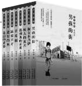
《常新港儿童小说精品套装》 常新港 著 天天出版社