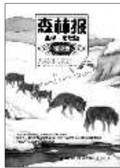
《森林报》 [苏]维塔利·比安基 著 春风文艺出版社