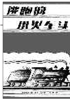
《逃跑的小火车头》 [美]维吉尼亚·李·伯顿 文图 21世纪出版社