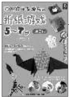
《聪明孩子都爱玩的折纸游戏(5-7岁)》 [日]主妇之友社 著 河南科学技术出版社