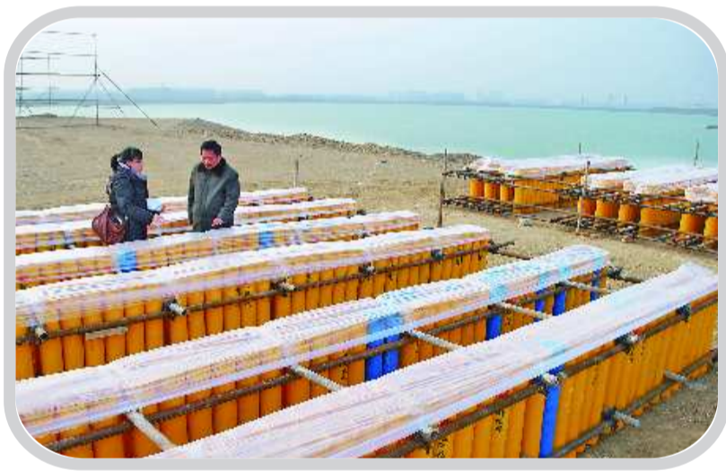
在北湖湾,千余个发射焰火的炮筒已准备就绪。