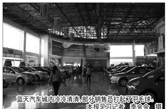
蓝天汽车城内冷冷清清,部分销售员打起了羽毛球。

在淄博路一出售花灯的郭女士告诉记者,现在南方的用工荒较为严重,人工费用的上涨也是导致今年花灯价格上涨的原因之一。