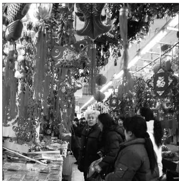
一商场内顾客正在选购花灯。

本报2月15日讯(见习记者 吕增霞 王瑞景) 元宵节赏花灯是我国传统的风俗习惯,15日,记者走访了东营的花灯市场发现,随着元宵节的临近,塑料灯笼销量大增,生意火爆。而受运费、材料、人工费用上涨的影响,花灯的价格与去年相比上涨了一成。