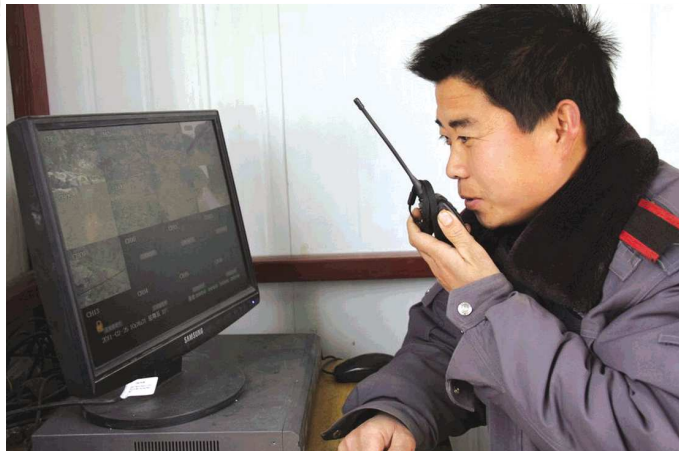
▲护矿人员在值班室用对讲机汇报监控情况。 ▶外来人员背着布包匆匆离开。