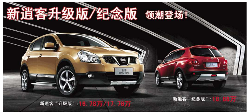
新逍客升级版/纪念版 领潮登场! 新逍客“升级版”:16.78万/17.78万 新逍客“纪念版”:18.88万