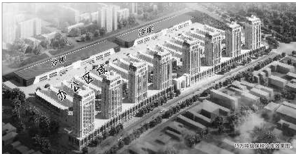
15万吨级保税冷库效果图。

近年来,烟台远洋渔业蓬勃发展,渔业加工企业雨后春笋般涌现出来。然而,因冷库库容能力有限,很多外籍远洋船只满载着鱼虾直奔韩国釜山、国内的青岛、大连等港口,而烟台的渔业加工企业接单后却只能再从异地“转港”将货拉回烟台,年损失上亿元。如今,随着省内最大冷链物流基地在烟布局,以及15万吨级保税冷库的开工,上述的窘境不久后将成为历史。