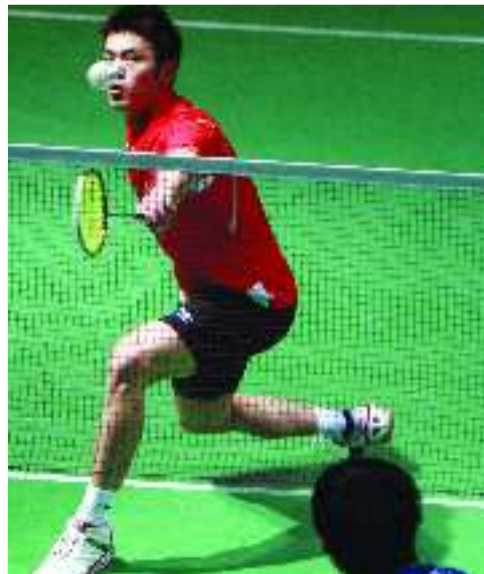
3月4日,中国选手林丹在比赛中回球。当日,在德国米尔海姆举行的德国羽毛球黄金大奖赛男单四分之一比赛中,林丹以2:0战胜韩国选手孙完虎,晋级四强。