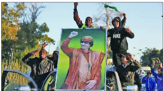
3月6日,利比亚首都的黎波里街头游行,庆祝政府军胜利。